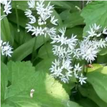
Die weichen Blätter der japanischen Herbstanemone bieten dem wilden Bärlauch einen wunderschönen Rahmen

Wie viele Gartenenthusiasten sitze ich im Winter am Tisch hinter Stapeln von Gartenheften, Pflanzenbüchern und Katalogen verborgen, und nur leises Murmeln und gelegentliches Erbeben eines Stapels teilt der Umgebung mit, dass ich noch lebe. Ich plane mein Gartenjahr!