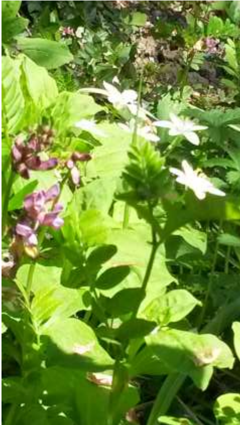
Die wilde Zaunwicke im Duett mit dem gepflanzten Doldigen Milchstern.