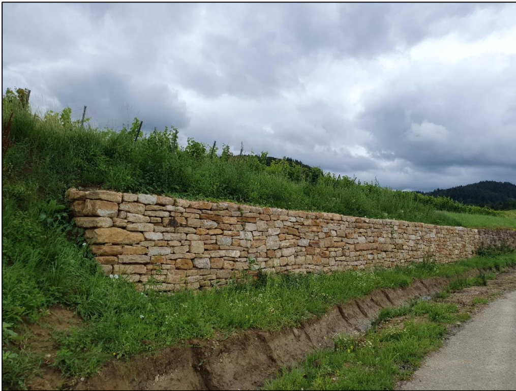
Abb. 1: Fertige Trockenmauer auf den Flurstücken 1787, 1788, 1789, 1790 (Gem. Ballrechten).