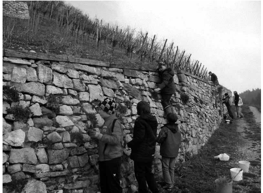
Viertklässler der Sonnenbergschule in Aktion.

Bußmann bedanken sich bei allen Aktiven für die wertvolle Unterstützung zur Bewahrung der natur- und denkmalgeschützten Strukturen am Castellberg.