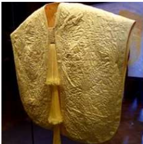
Spinnenseide war im 19. Jahrhundert sehr beliebt. Für den 2012 im Victoria & Albert-Museum, London ausgestellten Umhang sammelten 80 Mitarbeiter 5 Jahre lang Spinnweben.

Der Altweibersommer ist die Zeit der Spinnen. Die beeindruckende Kreuzspinne sitzt im Zentrum ihres Radnetzes, und im Gras entlarvt der Tau die teppichartigen Fallen der Baldachinspinnen. Faszinierende Tiere, deren Spinnenseide schon lange im Fokus der Technik steht: Viermal so belastbar wie Stahl und auf das Dreifache ihrer Länge dehnbar. Leicht und wasserfest, kann aber ähnlich wie Wolle Wasser speichern, widersteht mikrobiologischen Angriffen und wird von ihrer Erzeugerin recycelt, sprich wieder aufgefressen. Technisch unerreicht. Faszinierend sind auch ihre Fangtechniken und ihr Paarungsverhalten, das für die Männchen unter Umständen lebensgefährlich sein kann. Da reicht kein Blumenstrauß. Weniger bekannt ist, dass manche Arten hingebungsvolle Mütter hervorbringen, die ihre Nachkommen beschützen und sich schließlich von der Brut auffressen lassen. Mir ist, als höre ich manche menschliche Mutter verständnisvoll aufseufzen.