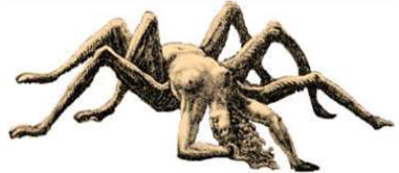
Arachne: Gustave Doré, 1861

Es ist nie pffiffig eine Göttin zu besiegen. Sie sind so nachtragend.