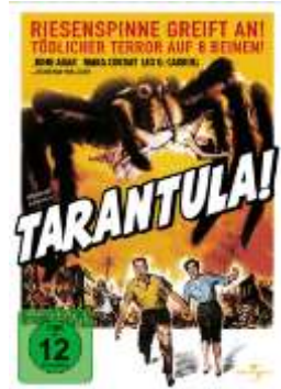
Fimlplakat des Horrorklassikers von 1955.

48.000 Arten wurden bislang beschrieben, nur ein Bruchteil des Artenspektrums. Sie sind genauso gefährdet wie ihre 6-beinigen Verwandten, die Insekten, nur baut niemand Spinnenhotels, es gibt kein Artenschutzprogramm, es herrscht eher ein gehöriger Respekt vor ihnen, der von Ekel bis Panik reicht. Arachnophobie, die Spinnenangst ist eine ernstzunehmende Störung, über deren Ursprung gerätselt wird. Es gibt nur ganz wenige Arten, deren Gift einem Kleinsäuger, geschweige einem Menschen gefährlich werden kann. Manche können empfindlich beißen, aber das können andere Lebewesen auch, ohne dass Mensch schreiend davon rennt. Ein Forschungszweig glaubt, dass es in der Menschheitsgeschichte gefährlichere Spezies gab, so dass sich die 8-beinige Silhouette als Alarmsignal ins Homo-sapiens-Gedächtnis geprägt hat. Die Psychologie vermutet Eltern hinter der Phobie, die schon früh ihre Abscheu an die Kinder weitergeben.